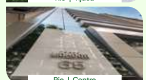
Rio | Centro