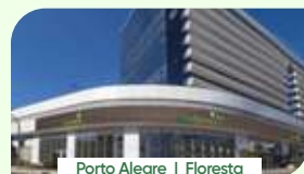
Porto Alegre | Floresta