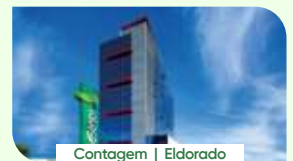
Contagem | Eldorado