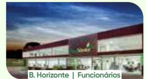
B. Horizonte | Funcionários