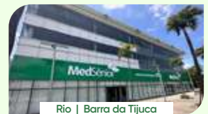
Rio | Barra da Tijuca