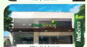
Niterói | Icaraí