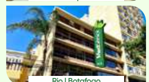
Rio | Botafogo