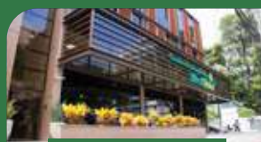
Vitória | Praia do Canto