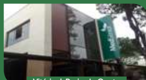
Vitória | Praia do Canto