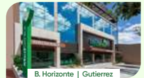
B. Horizonte | Gutierrez