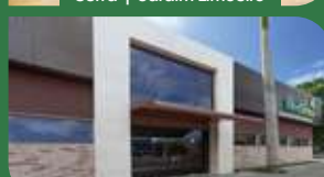
Vila Velha | Centro