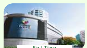
Rio | Tijuca