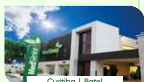
Curitiba | Batel